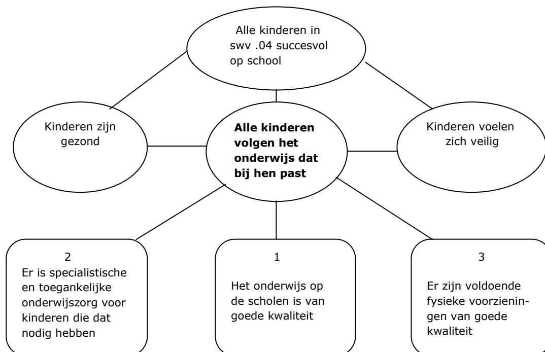
Fig. 1: visiemodel Passend Onderwijs

We beschrijven de gewenste situatie aan de hand van het visiemodel Passend Onderwijs zoals vermeld in het referentiekader passend onderwijs (pag.2):